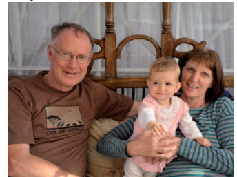
Patricias Eltern zu Besuch

Ferne hier bei uns in Afrika zu empfangen.