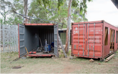
Container für Kalacha

Die Radiostation in Kalacha (Nord-Kenia) kann nach vielen Jahren nun realisiert werden, da genug Gelder zusammen gekommen sind. Viel von dem Material ist bereits angekommen und zwei Frachtcontainer werden gerade für die Räumlichkeiten vom Studio und der Sendeanlage vorbereitet.